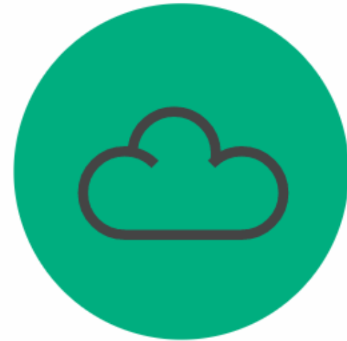
Concepto Integrador y complejo